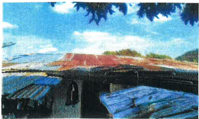
ภาพบ้านที่อยู่อาศัยภายนอก