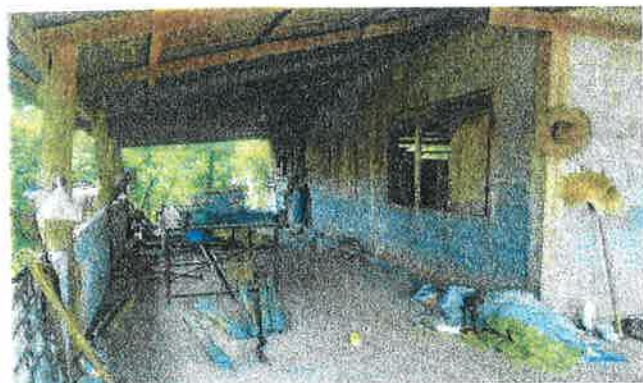
ภาพบ้านที่อยู่อาศัยภายนอก