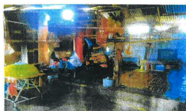
ภาพบ้านที่อยู่อาศัยภายใน