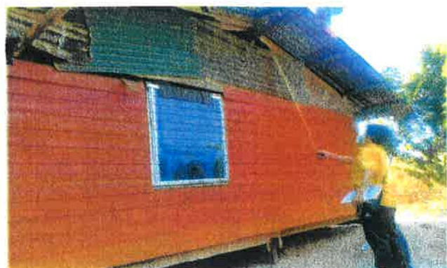
ภาพบ้านที่อยู่อาศัยภายนอก