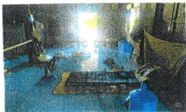
ภาพบ้านที่อยู่อาศัยภายใน